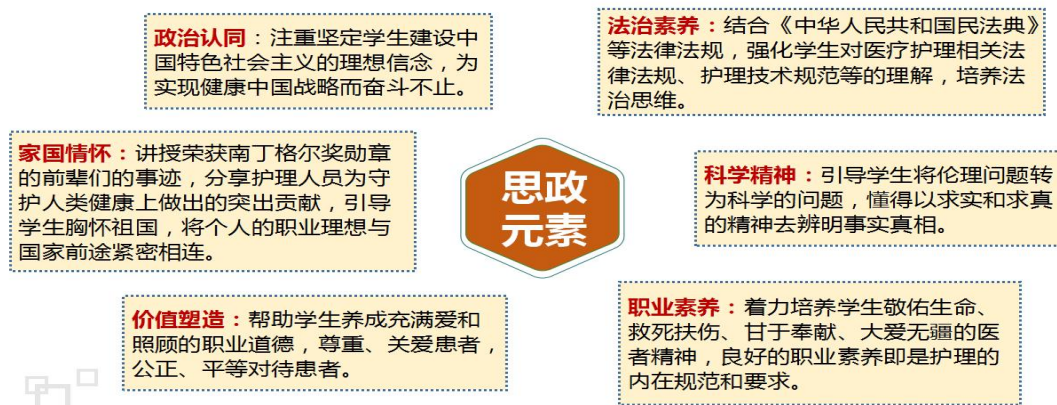
图3 《护理伦理学》课程思政融入元素