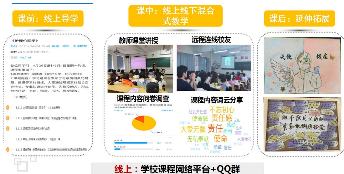
图7 《护理伦理学》课程思政实施图