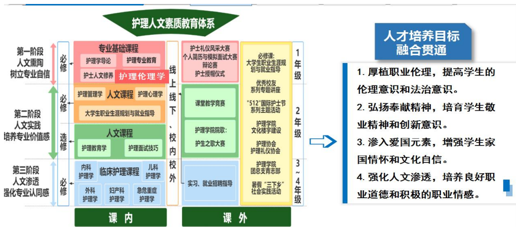
图1 《护理伦理学》课程人才培养目标构建图